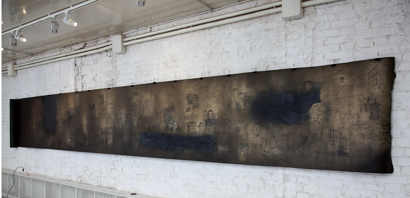
«Черный свиток», 2011 Пергамин, смешанная техника. 1х5м.