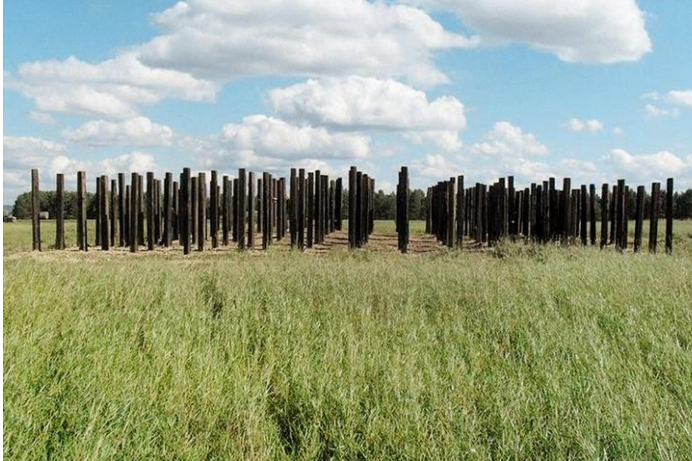
«Сад», 2011. 169 деревянных жд шпал. Мемориально-утопический лэнд-арт объект, г. Канск В рамках X Международного Канского видеофестиваля