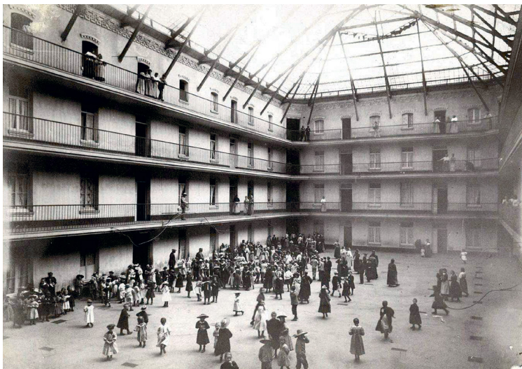
Вид внутреннего двора центрального корпуса Фамилистера. 1896

проектов такого рода, хотя их организация была в числе политических установок французского правительства эпохи, наряду с прокладкой широких городских магистралей, подоплекой которых была не столько художественная мысль, сколько стратегия защиты от революционных баррикад. Разумеется, и в СССР без политической подоплеки такие проекты, как Дом Наркомфина, тоже не могли появиться.