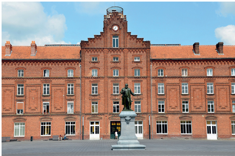
Фамилистер в Гизе. Центральный корпус и памятник Годену. 2014