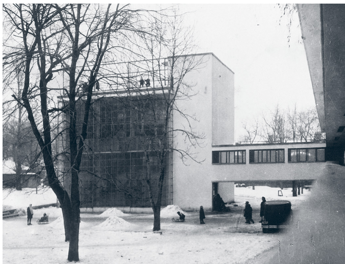
Вид с балкона 2-го этажа на коммунальный корпус. Начало 1930-х