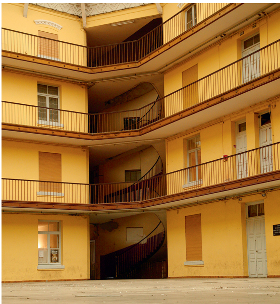
Внутренний двор центрального корпуса Фамилистера. 2010

не подвергалась спекуляциям в такой степени, успешных примеров было больше» 8 .