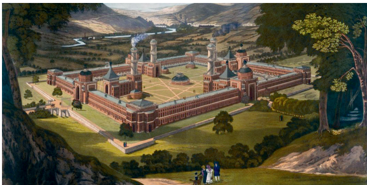
Вид на коммуну «Новая Гармония», нарисованный по описанию Роберта Оуэна. 1838. Гравюра Ф. Бейта