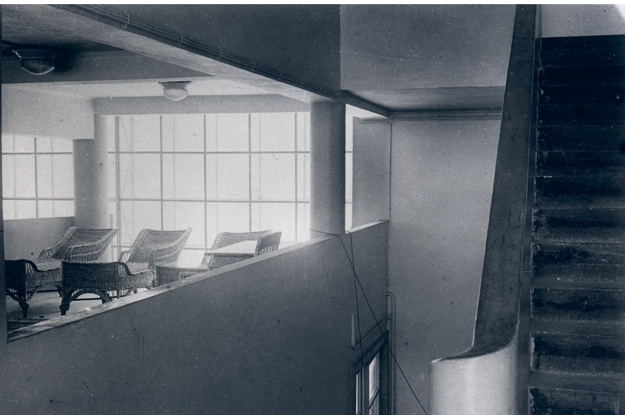
Вид антресоли 2-го этажа коммунального корпуса. 1930-е.