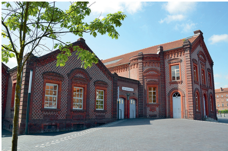
Фамилистер в Гизе. Здания школы и театра. Фото Patrick (flickr). 2014