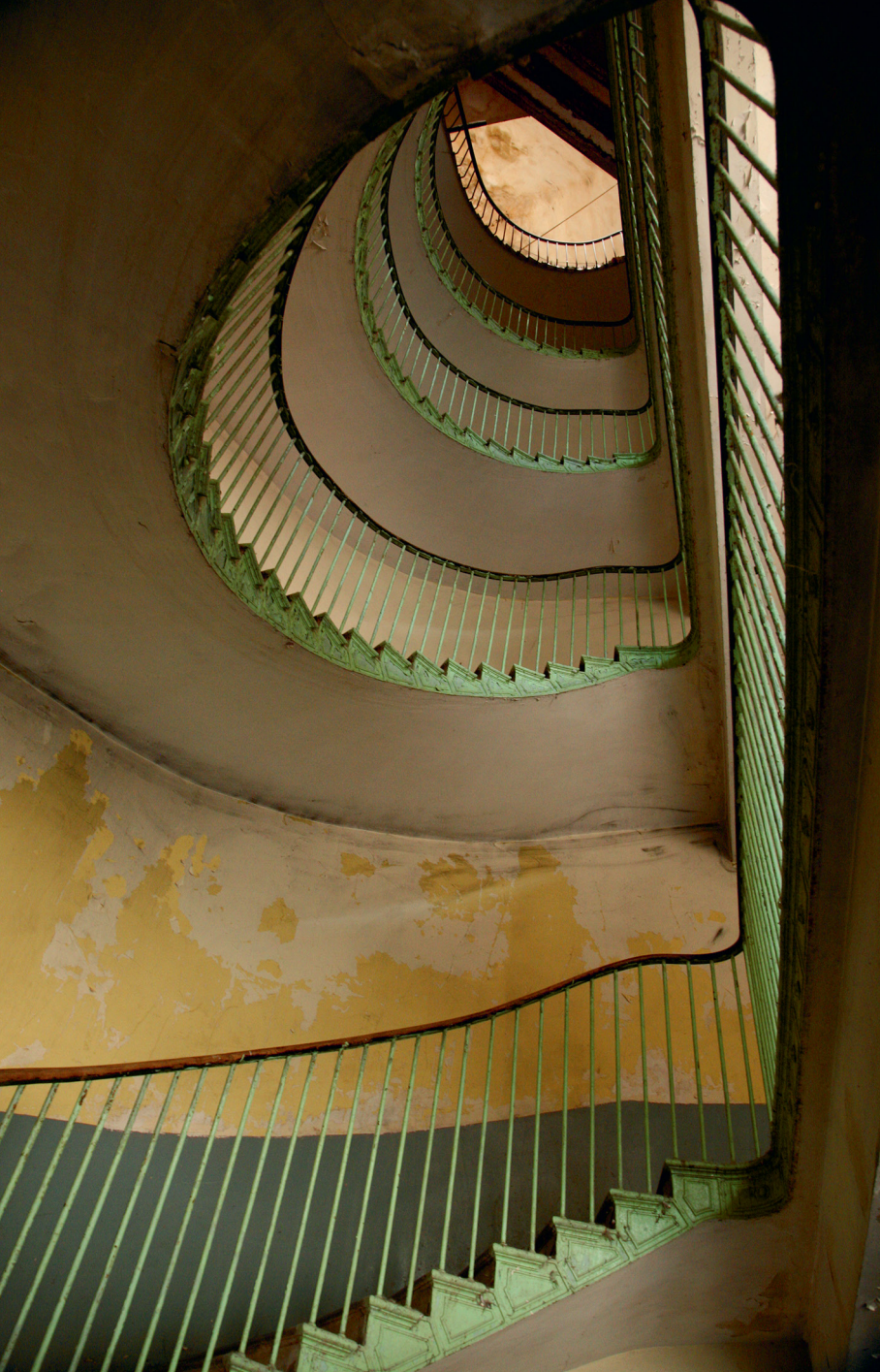
Лестница центрального корпуса Фамилистера. 2010