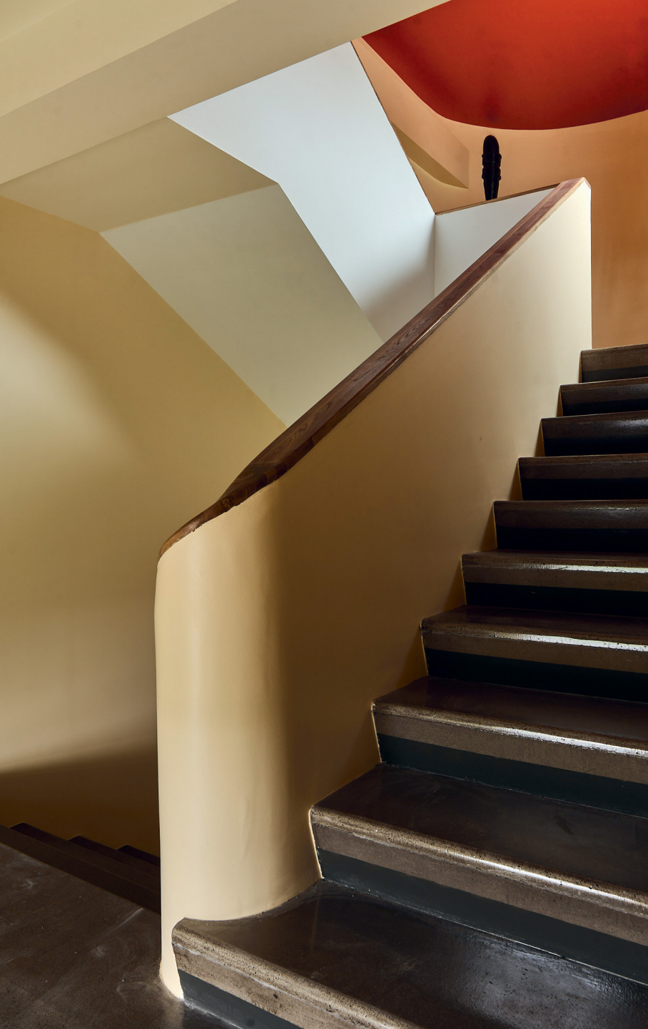
Вид последнего марша южной лестницы. 2020