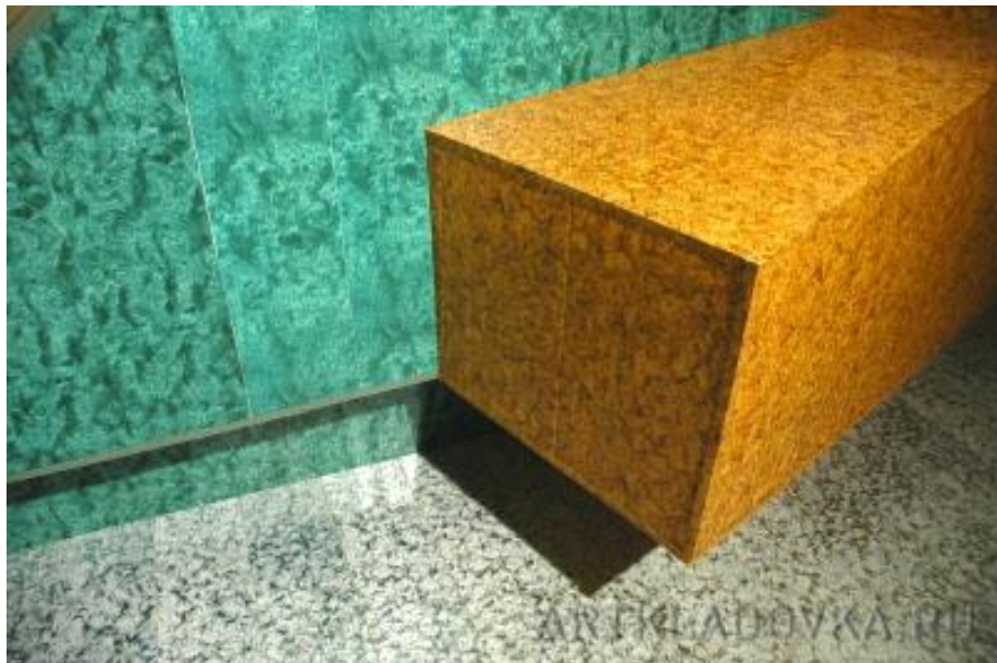
«Модули», 2005 Инсталляция, смешанная техника Музей Ленина, Первая Московская биеннале 2005 года