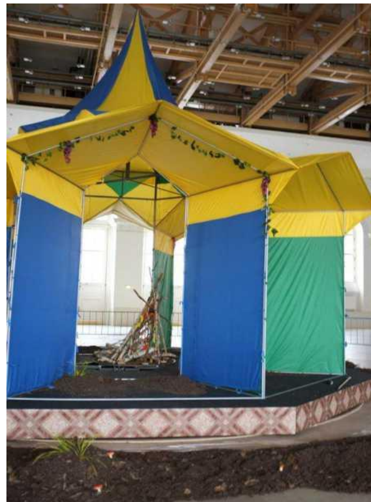
«Вооруженные мечтой», 2013