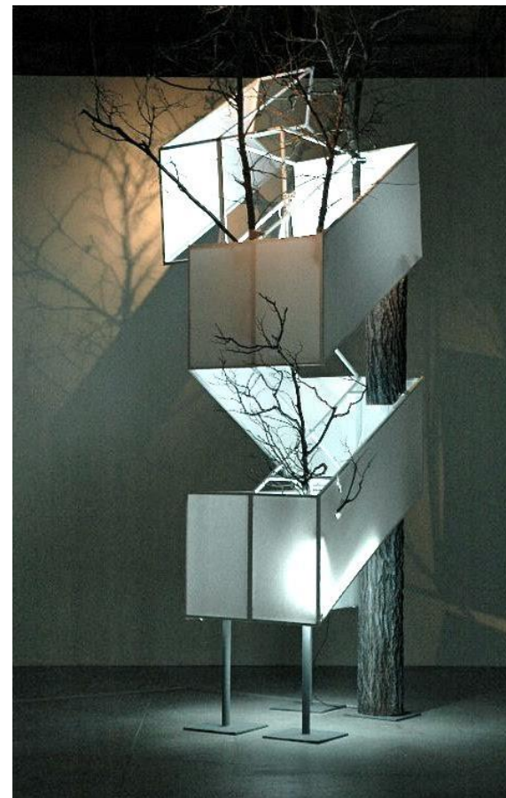
«Роща», 2010 Инсталляция Бумага, металл, пластик, дерево, лампы ЦСК «Гараж»