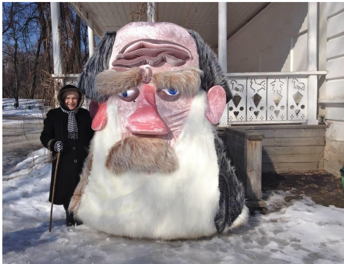
«Лев Николаевич в гостях у Константина Андреевича», 2013 Мобильная скульптура