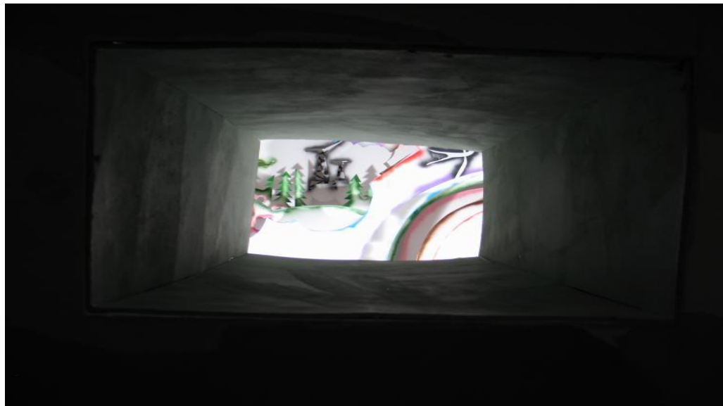
«Позитивные вибрации», 2006 фрагмент инсталляции XL Галерея

Если обойти сооружение по периметру, можно обнаружить маленькое окошко, позволяющее заглянуть внутрь, вместо внутренностей боевой машины там открывается ландшафт, напоминающий декорации кукольного театра. На первый взгляд этот светлый, ярко освещенный и весело раскрашенный инфантильный мир кажется совершенно безмятежным. Но стоит приглядеться, и среди деревьев и домиков обнаруживаются самолеты, бомбы и прочие милитаристские штучки – правда, совсем уж бутафорские. Ирина Корина сообщает, что эта диорама на самом деле составлена как бы из разнообразных трафаретов, причем трафаретов многократно использованных – именно следы краски создают радужный колорит пейзажа. Так что назначение у загадочного объекта все же не столько наступательное, сколько оборонительное: в своей утробе он заботливо хранит все стереотипные идеалы и страхи. Наверное, вырвись они наружу – эффект оказался бы разрушительным. Но законсервированные внутри бункера, эти трафаретные, много раз бывшие в употреблении, изношенные доблести и страсти сохраняют своего рода жалкий уют эдакого бидонвиля отработавших свое и наспех приспособленных для бытовых нужд идеологий. ( Ирина Кулик )