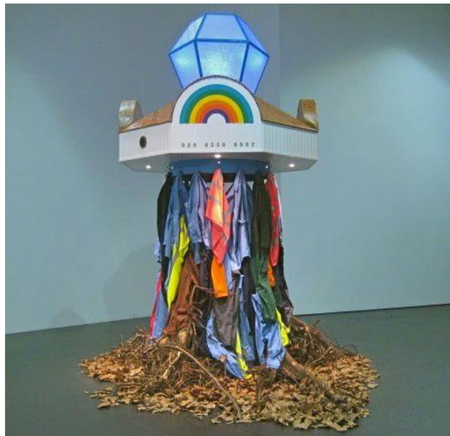
«Медуза», 2009 Инсталляция Смешанная техника Bloomberg Space, Лондон

Проектом «Медуза» для лондонской галереи «Bloomberg» Ирина подняла проблему, связанную с болезненной темой гасторбайтеров, которых, как нечто дикого, непонятного, принято чураться. Их оранжевые с фосфоризирующими полосками куртки висят на гигантских пнях среди кучи листьев под козырьком курортного казино. snob.ru