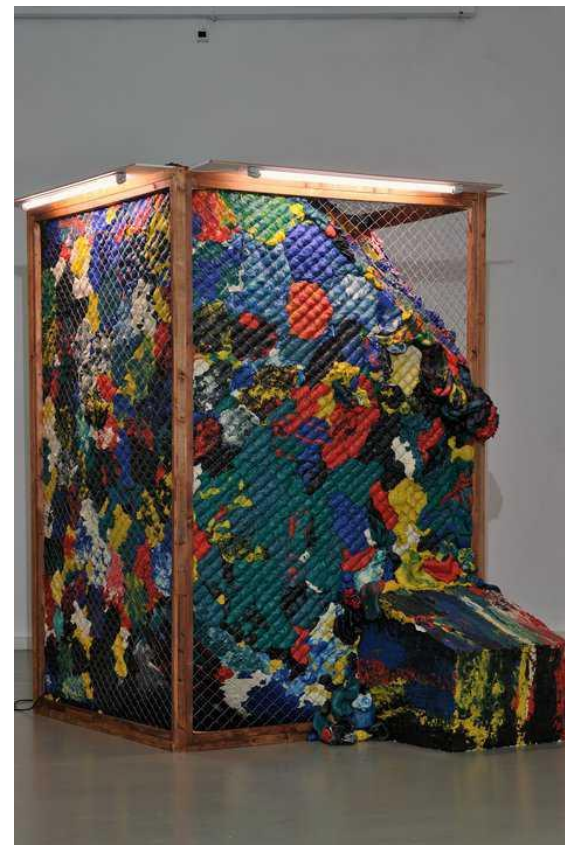
«Показательный процесс», 2010 Инсталляция Пластилин, сетка металлическая, дерево XL -галерея

Пластик, из которого выстраивалась новая реальность в 2000-е, вдруг потерял для меня свое значение. Мне захотелось использовать пластилин как очень специфический материал. Пластилин ассоциируется с детством, с игрой. Пластилин держит форму, но при этом он не застывает окончательно: разогрев его в руках, вы можете придать ему совершенно другие очертания. Я хотела сделать работу о свободе, о преодолении преград. О победе, но не революционной, а за счет иных свойств материи — это аморфная победа, благодаря пластичности, вязкости и огромной массе. ( Ирина Корина в интервью, Алина Гуткина )