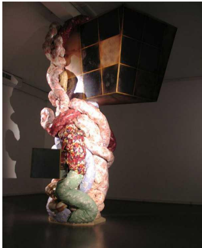
«Ночной тариф», 2008