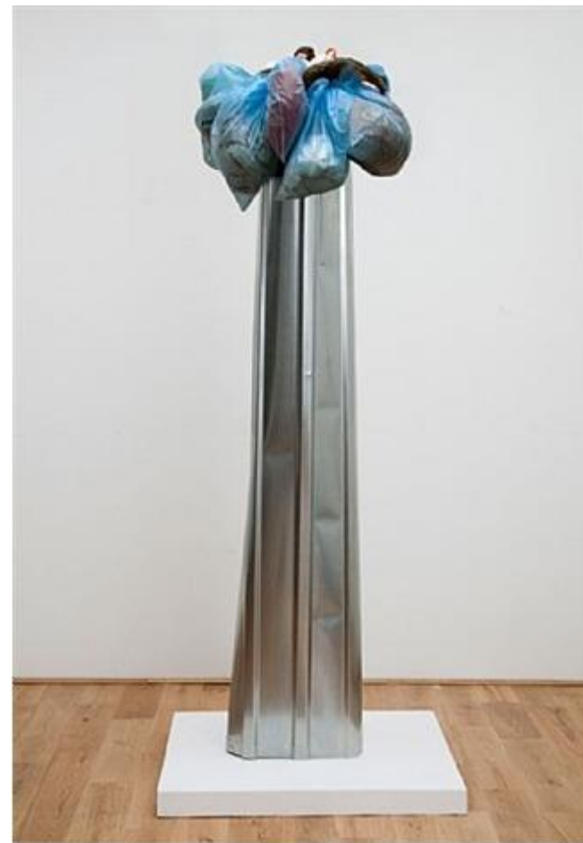
Capital , 2012 Installation, mixed media Saatchi Gallery

At over 2 metres high, Irina Korina's Capital (2012), a column-like 'ruin' composed of what looks like refuse material, stands as an ironic monument to contemporary culture. The sculpture is made up of ordinary thin plastic bags filled with discarded, donation clothing, tied up and hung flaccidly from the centre of a banged up corrugated metal pillar. It has been designed with a child-like imagination and simplicity – dumpsite art, made out of a top-heavy consumerism fallen by the wayside. The work's title seems just as uncomplicated and direct; it's hard to ignore the obvious play it makes between the central Marxist work critiquing capitalism as an economic system and the term for the top element (Ionian, Doric, etc) of a column in classical architecture, here made out of waste. Capitalism, the sculpture seems to be suggesting, is no more than this: the redistribution of excess. Knowing the context in which Korina works, another meaning of 'capital' appears perhaps even more urgent – the general condition of post-Soviet, post-socialist utopian disarray in the city centres of Russia today. Lupe Núñez-Fernández