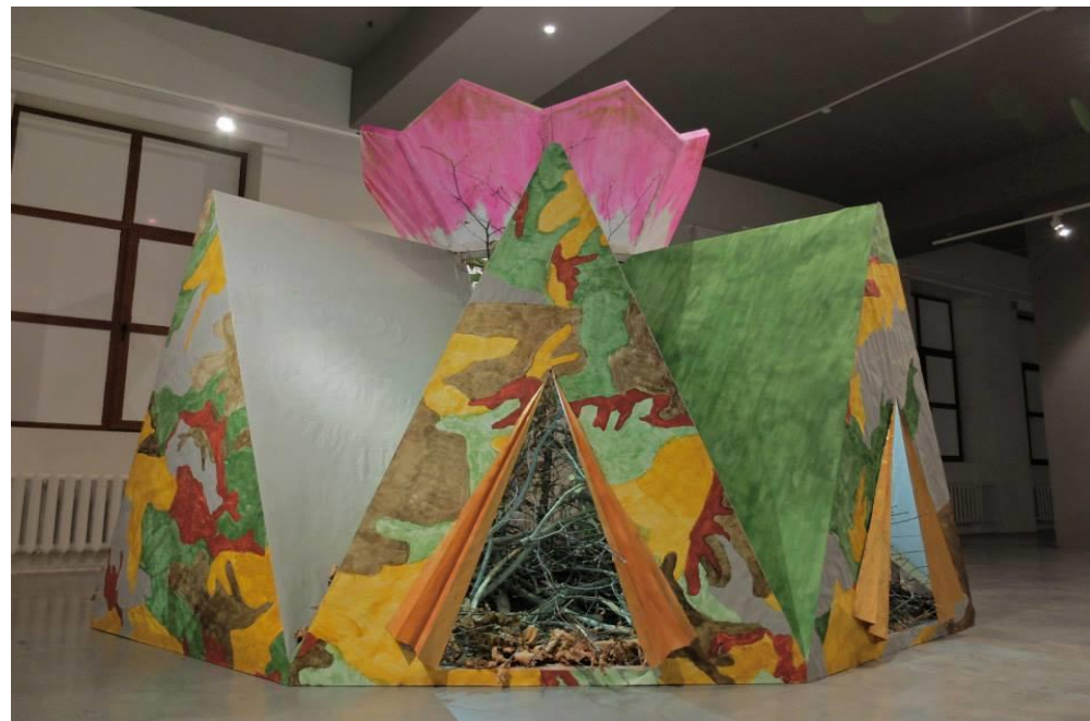
«Укрытие Лотос», 2015 ЦСИ «Заря», Владивосток

Идея палатки для военнослужащих и одновременно небольшого мобильного храмового сооружения воплотилась в «Лотосе» как соединение непосредственности детского рисунка и профессионального архитектурного макета. Перед нами стандартный модуль, из которых строится новый тип военных поселений - несколько спальных палаток, объединенных в храмовое пристанище, внутри которого - непроходимый бурелом. Так что оказывается невозможно проникнуть внутрь этого изнутри ошестинившегося сооружения. Пресс-релиз