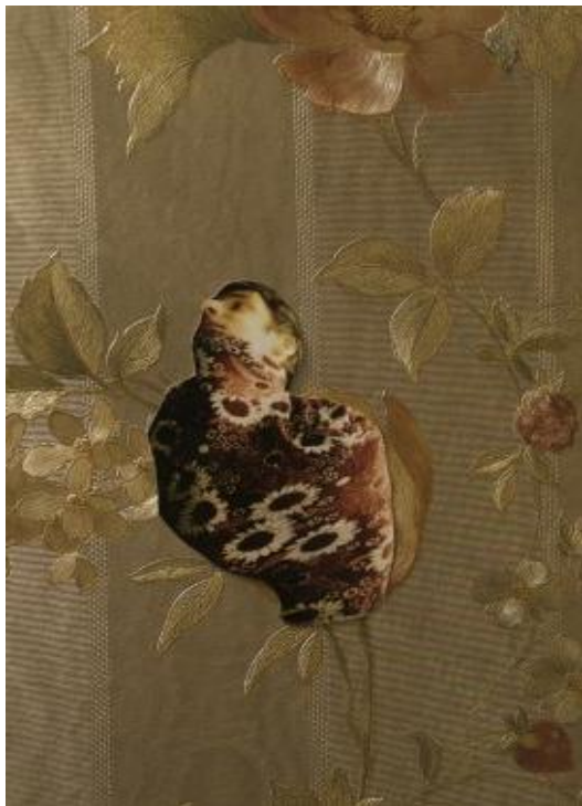
«Камуфляж», 2009 фрагмент инсталляции XL Галерея