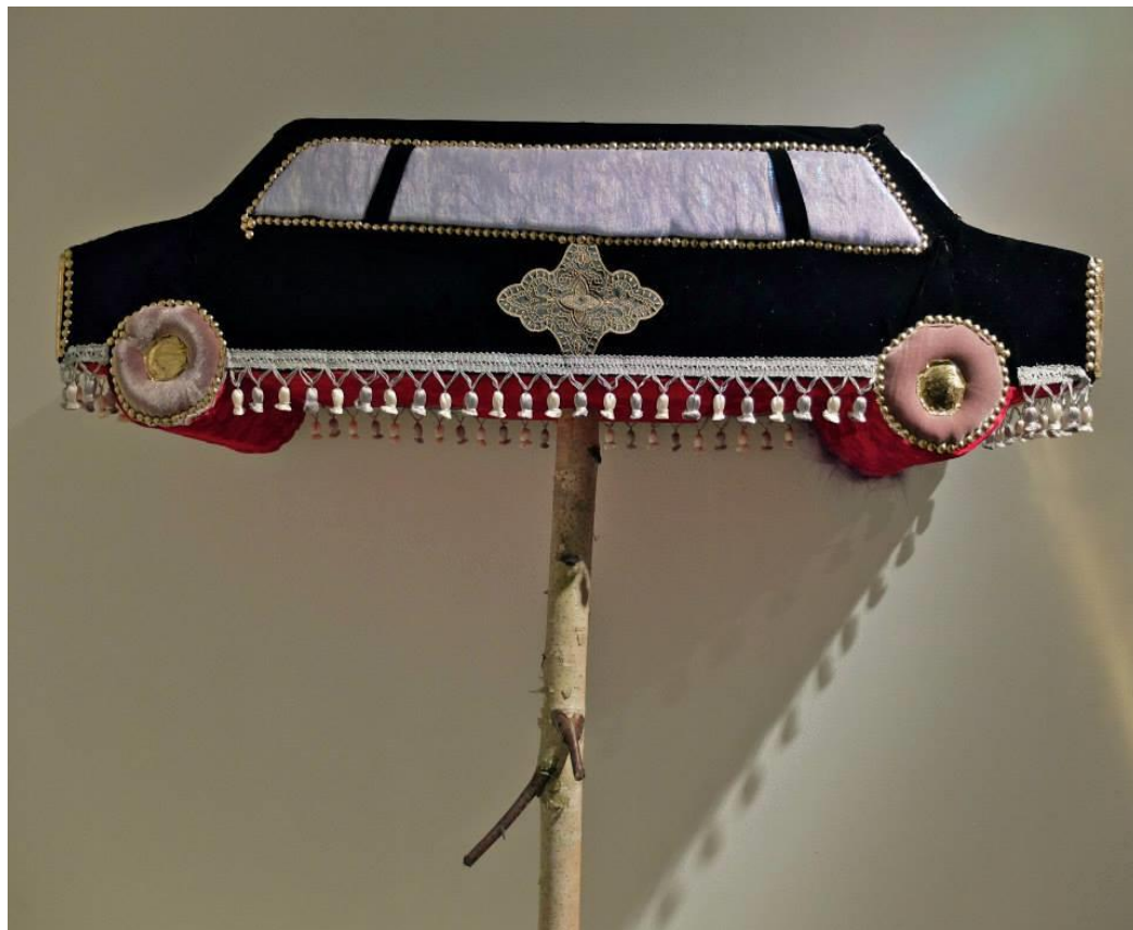
«Припев», 2013 Тотальная инсталляция, объекты, графика

С помощью темной полиэтиленовой пленки образуется узкий проход, по которому надо идти вдоль «строительного мусора» в основной зал, — ситуация, понятная жителям Москвы, часто пользующимся бесконечно реконструируемыми подземными переходами. Многие потолочные плиты отсутствуют, зловеще тянется потрепанная вентиляционная труба. В одном из углов художница построила клумбу — прямо как работники муниципальных служб, только вместо раскрашенных опилок небольшие гранулы упаковочного наполнителя. В витринах, расставленных по залу, видны какие-то веточки (одна ветка медленно кружится), все тот же наполнитель, поддуваемое вентилятором и липнущее к прозрачным стенкам блестящее конфетти. Свисают с потолка или насажены на палки яркие, сшитые-сбитые объекты: огромный артишок, двуглавый орел, похожие на меховые шапки горные вершины, яхта, Эйфелева башня. (Сергей Гуськов)