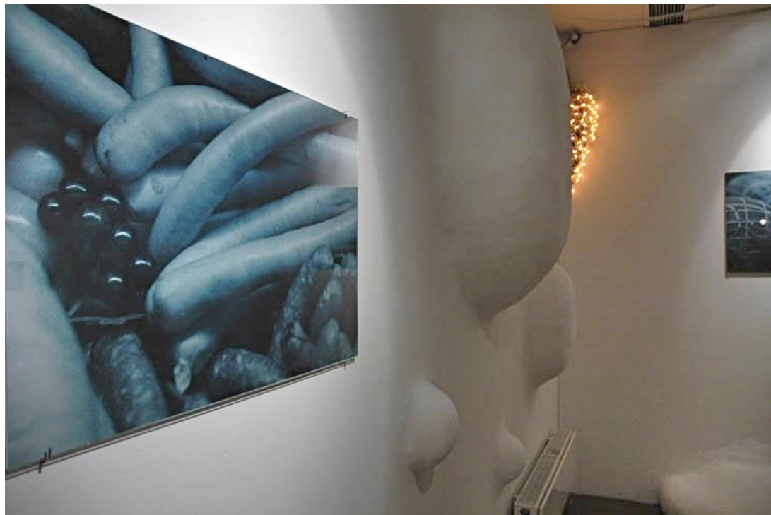
«29 Трансформаций», 2009 Инсталляция XL Галерея